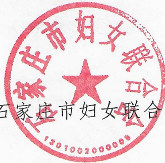
石家庄市妇女联合会