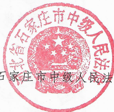
石家庄市中级人民法院