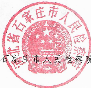
石家庄市人民检察院