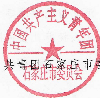
共青团石家庄市委