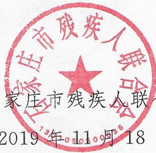
石家庄市残疾人联合会