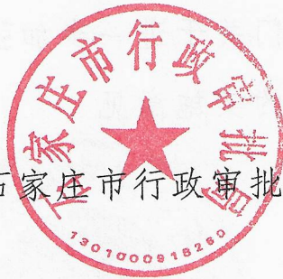
石家庄市行政审批局