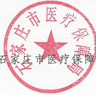
石家庄市医疗保障局