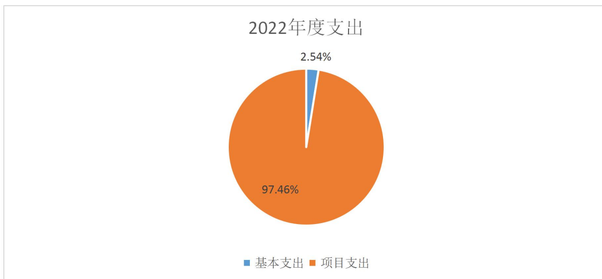
图 2：支出决算构成情况（按支出性质）