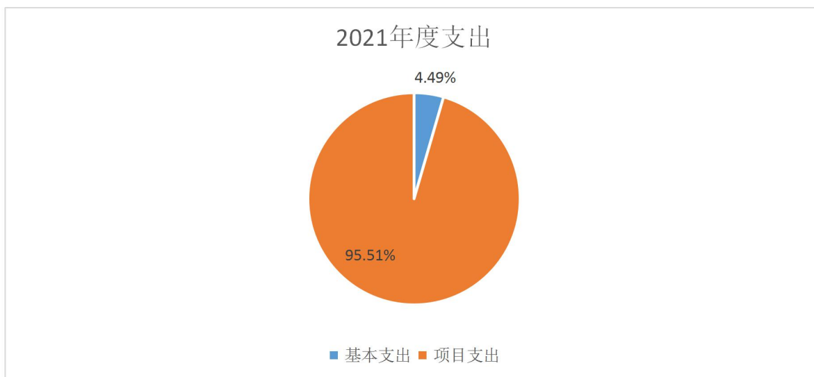
图 2：支出决算构成情况（按支出性质）